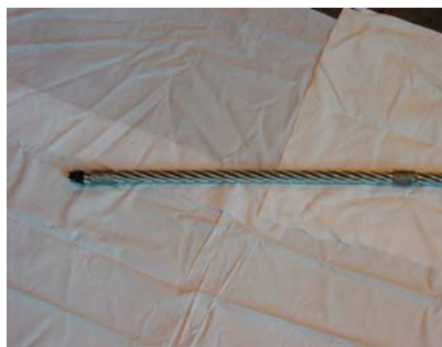
Bendselwire påmontert på i enden og inne på wire