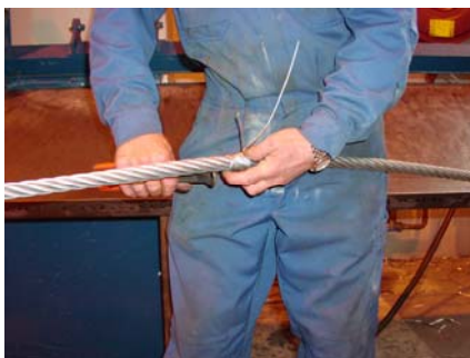
Montering av bendselwire

Deretter sikrer en enden på kabelstrømper med en bendselwire eller en ståltråd ved å surre bendselwiren rundt enden av kabelstrømper. Deretter ruller en tape over bendslingen slik at der ikke er noen skarpe kanter som kan henge seg fast under tredding av wiren.